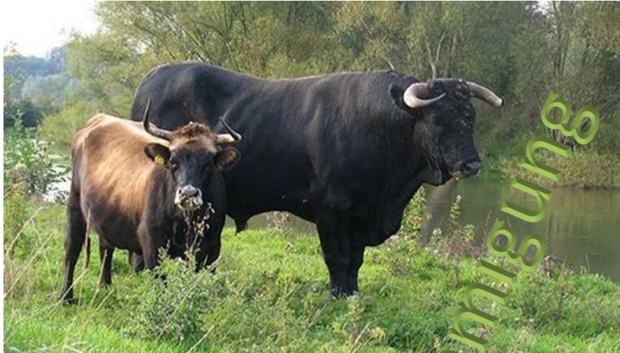
Größenvergleich Taurusbulle und Heckkuh